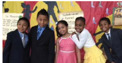
Estudiantes de Lenguaje Dual de la Escuela Primaria Cleveland