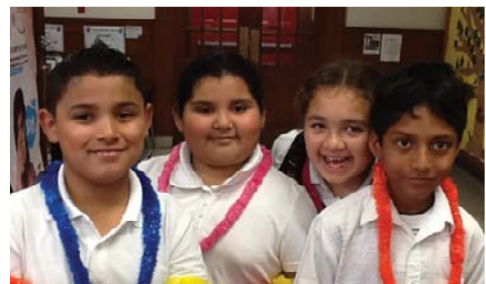
Estudiantes de Lenguaje Dual de la Escuela Primaria Powell