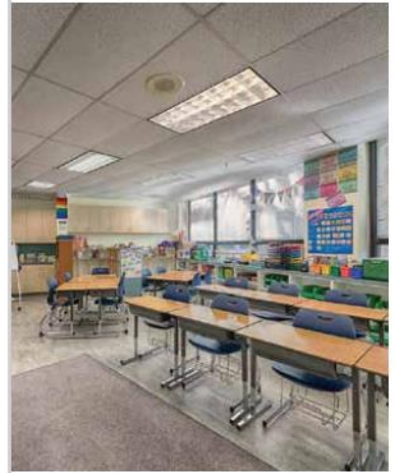
Fotos del documento de resumen ejecutivo, cortesía de Jones Lang LaSalle Americas, Inc.