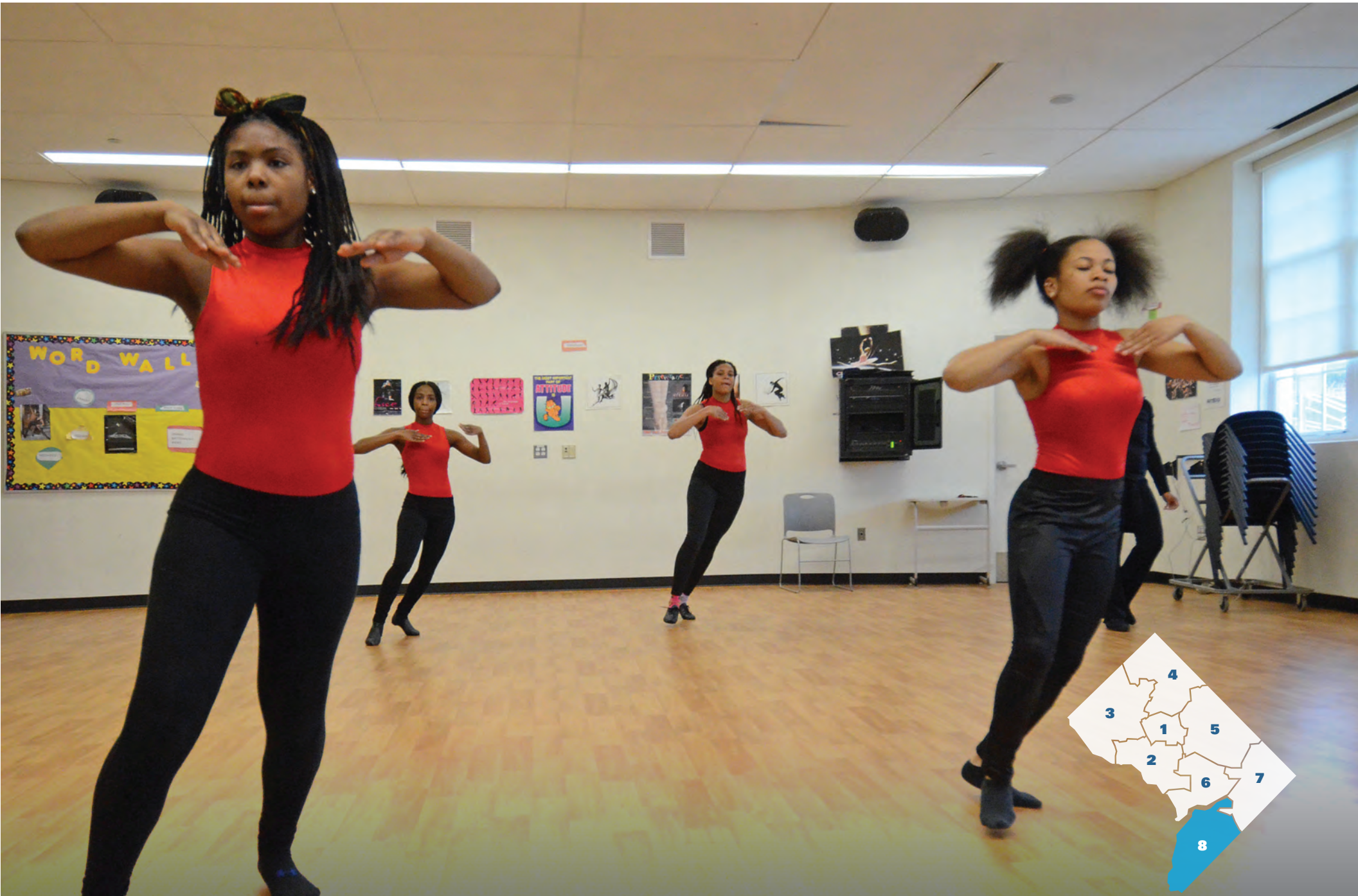
阿纳卡斯蒂亚高中学生参加作为选修课程之一的舞蹈课。