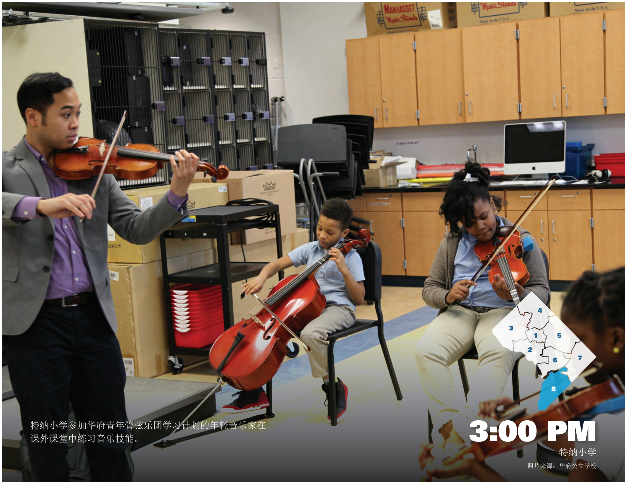
特纳小学参加华府青年管弦乐团学习计划的年轻音乐家在课外课堂中练习音乐技能。