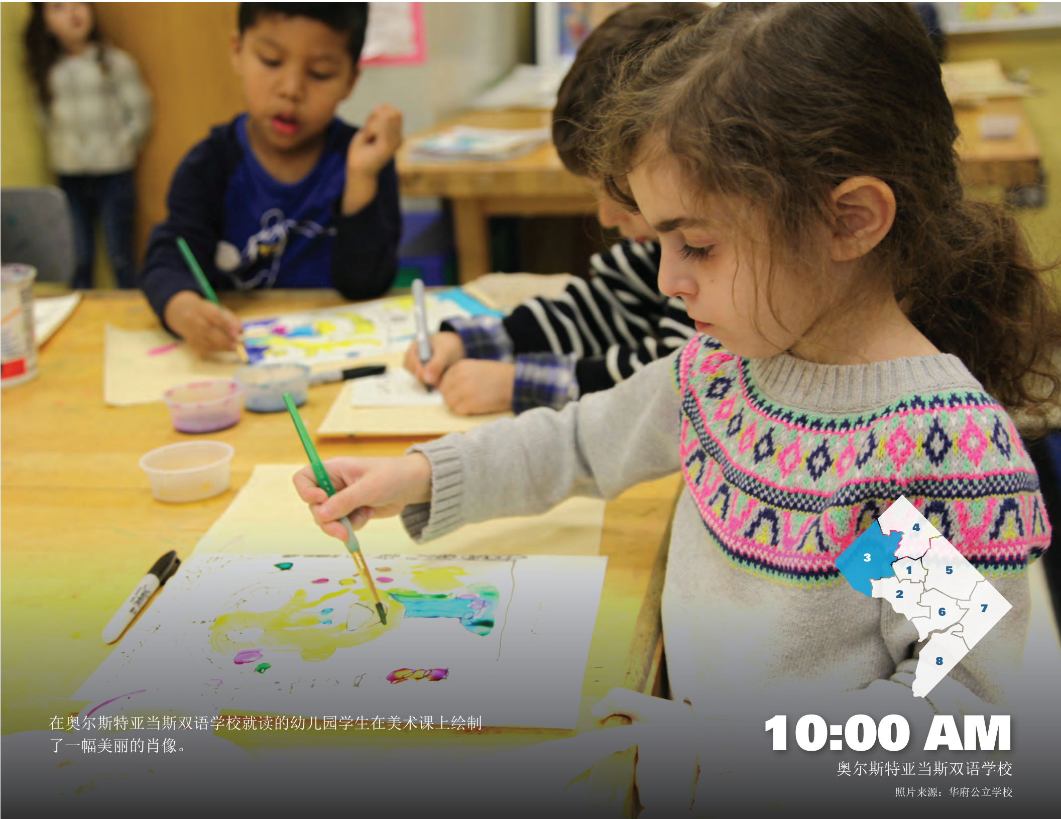
在奥尔斯特亚当斯双语学校就读的幼儿园学生在美术课上绘制了一幅美丽的肖像。